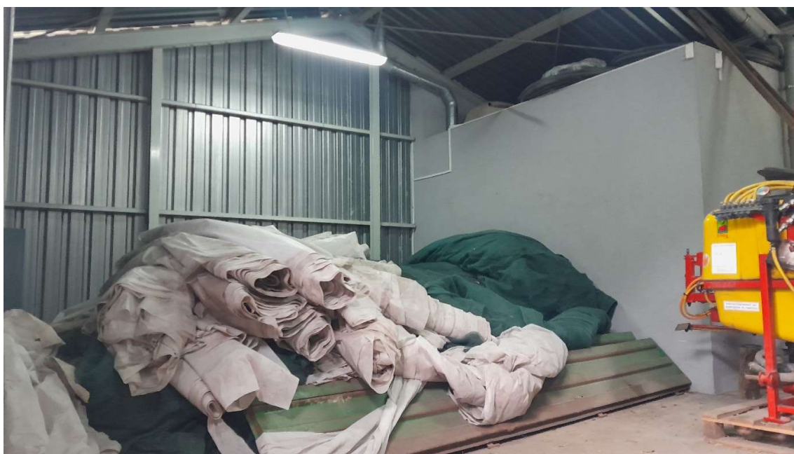
Miejsce planowanego posadowienia chłodni.